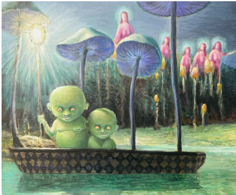
Marko Jakše, Die Beobachter , oil, 45x55,5cm, 2026

Der Erfindungsreichtum ist immense, und doch sieht man in dieser Ausstellung bei Šumonja das wiederkehrende Motiv der dystopischen Landschaften, während bei Jakše oft eine dem Kubismus und Surrealismus näher angrenzende Architektonik zu beobachten ist. Die riesigen und bedrohlichen Fikto-animale der Ausstellung in Zagreb ( Antic-ontemporari ) sind hier nicht oft zu sehen; bei den kleineren Formaten beschränkt sich Jakše auf gelegentliche Absonderlichkeiten. Engel mit Heiligenschein spriessen aus Teichpflanzen, vorne im Boot sitzen the little green men (über die der chaotische country-rock Sänger Devendra Banhart einmal einen wunderschönen Song geschrieben hat) und schauen auf uns, beobachtend.