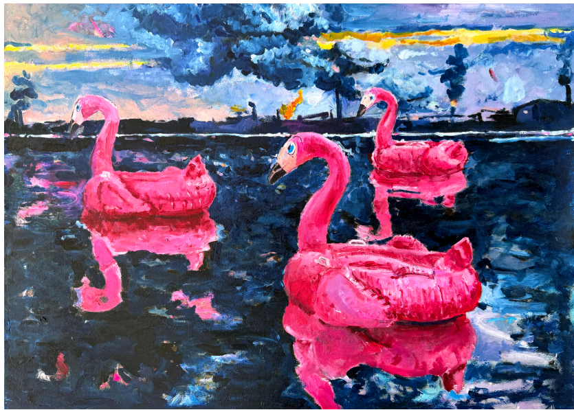
Bojan Šumonja, Inflated Reality II , oil on canvas board, 50x70 cm, 2025.

Was meine ich mit „Kreatürlichkeit“? Mit Fantastik und den Fikto-Animalen? Oder, anders gefragt: Kann man sich verlieren , wenn man der Natur etwas abzurufen versucht? Etwas aus Naturen, Kreaturen, herauszukristallisieren versucht, oder gleichsam auch aus Aura oder Klischee-Ikonizität etwas zu erjagen, Sammler und Jäger-Maler werden? Mit dem Erjagen auch der postmodernen Sensibilität der Zitate einen Hieb versetzen, einen kleinen Fusstritt?