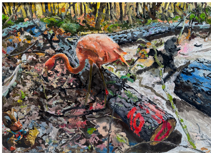
Bojan Šumonja, Warped reality , Oil on canvas board, 60x50 cm, 2025

Die Vogel Strauss-Menschen in Bojan Šumonjas Gemälde The Healing Power of Mother Earth , oder Zecija Rupa (Rabbit Hole) – aus einer früheren Ausstellung ( Omnibus , 2019 in Zagreb)– scheinen kollektiv den Kopf im Sand zu begraben. Sie haben mich beeindruckt, aber gleichzeitig könnte man den Mythos selbst hinterfragen, um die Ironie und den bitteren Sarkasmus von Bojan Bojan Šumonja zu begreifen oder anzugreifen, denn der Vogel Strauss, der einzige und grösste flugunfähige Vogel, steckt seinen Kopf gar nicht sprichwortartig in den Sand aus Angst, sondern um die Eier seiner Muldenester zu bewachen. Wenn Angst aufkommt vor Feinden, kann der Strauss weglaufen, mit Laufspitzengeschwindigkeiten bis zu 90 km/h.