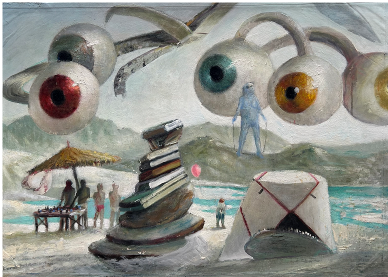
Marko Jakše, Die Fata Morgana des Jungen , oil, 60x84,5cm, 2025.